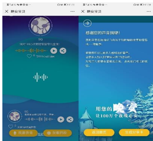
“晚安宝贝”员工录音界面

2019年7月，重庆伊藤忠的同事们通过对农村儿童举办教育活动的公益团体“歌路营”的官方微信公众号——晚安宝贝的活动链接，为了能使父母不在身边的农村儿童安心进入梦乡，进入录音界面，进行30秒的晚安语录制，把我们想对农村孩子们说的话和问候，通过歌路营配上1001个故事，送到孩子们耳边，让他们能感受到我们的关爱。在爱的环境下成长，长大后才懂得付出爱。