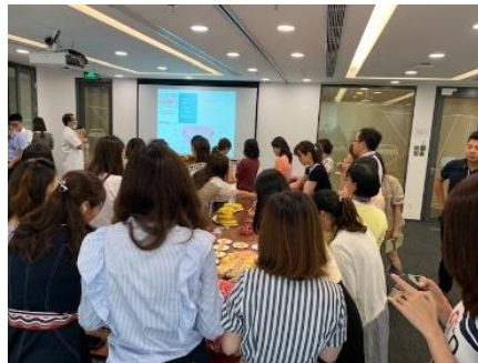
健身课堂/闲置物品交换